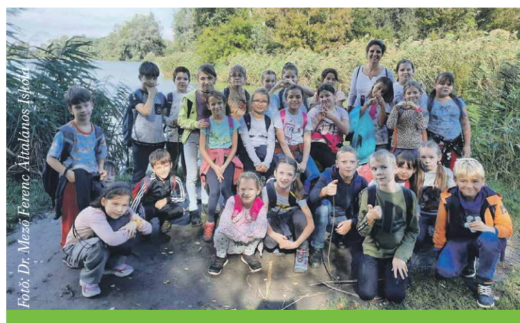
A Mező Ferenc iskola diákjai októberben összesen 3500 kilométert tettek meg gyalogosan

A pedagógus hangsúlyozta, örülnek az eredménynek, de nem dőlnek hátra, már tervezik az újabb programot: tavasszal háromhetes triatlonon indulnak. Az első hetet gyalogosan, a másodikat két keréken, míg a harmadikat vizes környezetben kell majd teljesíteni. A legjobb eredményt elérő osztályok a Sport43 Program keretében ingyenes falmászáson, síelésen, görkorsolyázáson, kerékpározáson és evezésen vehetnek részt. R. T.