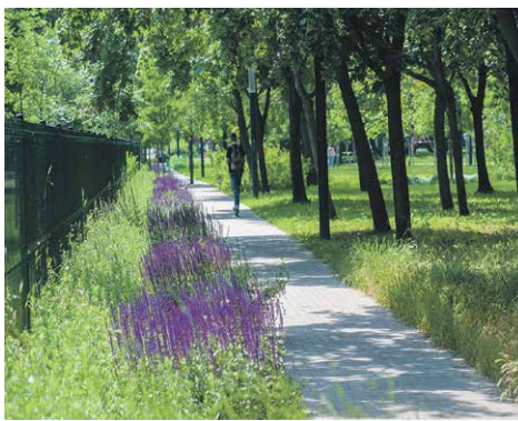
A kerületi zöldfelületek gondozását ezentúl nem külső céggel, hanem önerőből oldja meg az önkormányzat

Az átépített Bosnyák utca árnyékolására körülbelül 60 fát ültetnek el egymástól