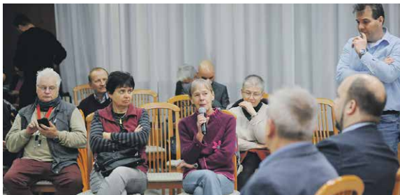
A résztvevők egyetértettek abban, hogy a parkolási nehézségeket csak az egész kerület díjfizető zónába vonása oldaná meg

Mélygarázsok építését nem teszi lehetővé az önkormányzat büdzséje, ezért csak egyes zöldfelületek parkolóvá alakítása jöhet szóba, viszont a megmaradó zöldterületeket úgy kell lekezíteni, hogy azokra ne lehessen ráállni.