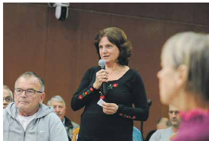
Ezen a fórumon is több kérdés hangzott el a Bosnyák téri beruházásról