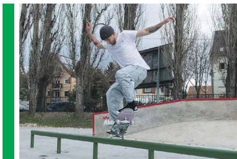
A 405 m 2 területű pálya néhol eléri a 100 cm magasságot

Révész Máriusz aktív Magyarországért felelős államtitkár külön köszöntötte a Kaffka Margit és a Németh Imre Általános Iskola diákjait, akikben a pálya po-