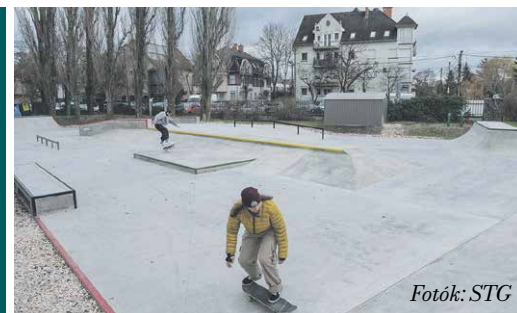
A Mogyoródi úti Sportpályán most megnyílt görpark a 14. ilyen létesítmény az országban

tenciális használóit látta. Majd felhívta a figyelmet a mozgásra, mint az egészséges életmód egyik fontos elméje.