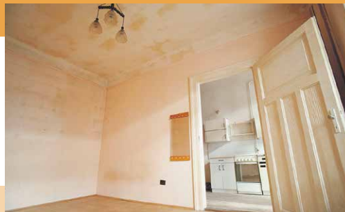
A Várna utca 8.-ban tíz, 27–40 m 2 közötti lakás teljes felújítását és korszerűsítését végzik el