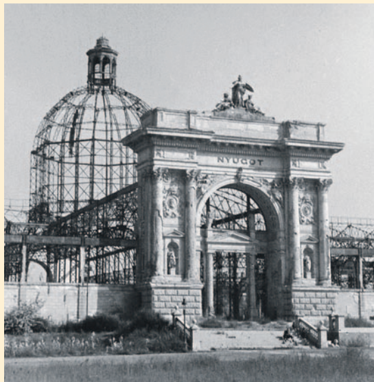
Az Iparcsarnoknak csak a vázszerkezete maradt meg

sereg (15. AAF – 15. Army Air Force) 440 bombázója és 279 kísérő vadászgépe hajtott végre. A repülőgépek 40 hullámban támadtak. Célpontjaik a pályaudvarok és az olajlétesítmények voltak. A legtöbb bomba Csepelre, a Szabadkikötőre, Ferencvárosra, Kőbányára, Angyalföldre és Zuglóra hullott. A Keleti pályaudvarnak szánt bombaszőnyeg elcsúszott és az akna Erzsébetváros külső részére, a Városligetre, illetve Zugló lakó-