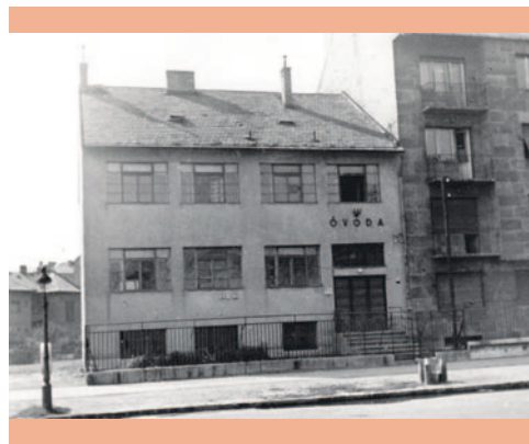
A Barakk Óvodát 1944-ben adták át, majd 1948-ban az intézményt áthelyezték az Egressy úti cipő- és felsőrészkészítő üzem helyére

Az idén 80 esztendőős óvoda története szorosan összefonódik Törökőr fejlődésével. Ahogy a városrész növekedett, úgy lett egyre nagyobb igény gyermekintézményre is. A mai Stefánia út – Ifjúság útja – Dózsa György út által határolt terület alkalmas volt egy új ovi létesítésére. A Barakk Óvodát 1944-ben adták át, és talán még ma is állna, ha néhány év múlva az említett területen nem kezdődött volna el a Népstadion építése. Az ovit 1948-ban áthelyezték az Egressy úti cipő- és felsőrészkészítő üzem helyére. A Népstadion és az óvoda kapcsolata a kezdetektől rendkívül