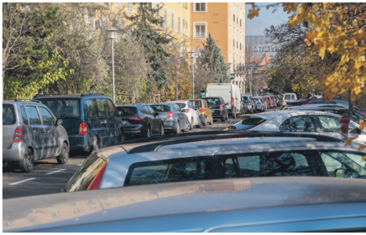
A gyermekszállítási várakozási hozzájárulás kiadása a zuglói szülőknek továbbra is díjmentes marad

A támogatást a lakossági várakozási hozzájárulás költség-térítésének megfizetésével lehet igénybe venni. Ennek összege a 2017 óta változatlan 2000 forintról 6000 forintra emelkedett. Az önkormányzat a 60 év feletti kérelmezőknek jelentős kedvezményt biztosít, nekik 6000 forint helyett csak 2000 forintot kell fizetniük. A testület a lakosság igényét figyelembe véve