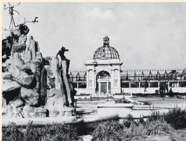
A Városliget látványosságát, a Sió tündér legendáját bemutató világító szökőkutat is szétzúzták a bombák

Október első felében a rossz időjárás és a magyar fegyverszüneti tárgyalások miatt jelentősen csökkent a bombázás intenzitása. Miután október 15-én elbukott a kiugrási kísérlet, 19-én és 26-án ismét bombák hullottak Zuglóra, melyek öt embert öltek meg. Novemberben pedig újabb három személy esett a légiaknak áldozatául. December elejétől Budapest frontváros lett, ekkortól már nem támadták több száz gépből álló légi kötelékek, de a bombázások állandósultak, mert a Budapesten katlanba zárt német-magyar erőkre folyamatosan csapásokat mértek a Vörös Hadsereg repülőgépei.