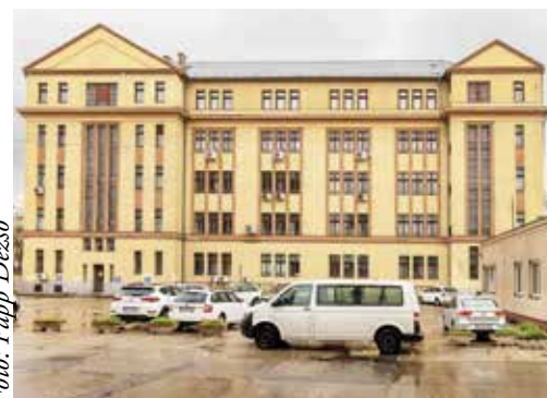
Az Egressy úttal párhuzamos épületet eredetileg raktárnak szánták, de átadása óta irodaként használják