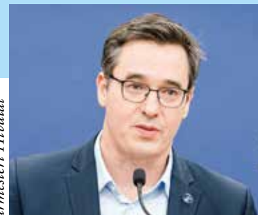
Karácsony Gergely: Legkorábban nyolc év múlva költözhetnek be az első lakók