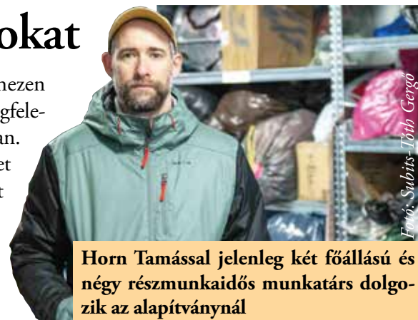
Horn Tamással jelenleg két főállású és négy részmunkaidős munkatárs dolgozik az alapítványnál

alta, hogy a budapestiek csak nehezen tudják eljuttatni adományaikat a megfelelő helyekre, ezért segített a szállításban. Ez után kapta az Adománytaxi nevet később az alapítványa, amelyet azért hozott létre, hogy legyen egy olyan szervezet, amely eljuttatja a felajánlásokat a mélyszegénységben lévő, 500-1000 fős településekre. A szervezet az adományok szállításán túl tanfolyamokkal és jogi tanácsokkal is segíti a rászorulókat. Emellett cégeknek olyan csapatépítő tréningeket tart, ame-