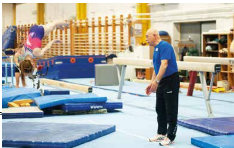
Reméli, diákjai minden nagy nemzetközi versenyen ott lesznek