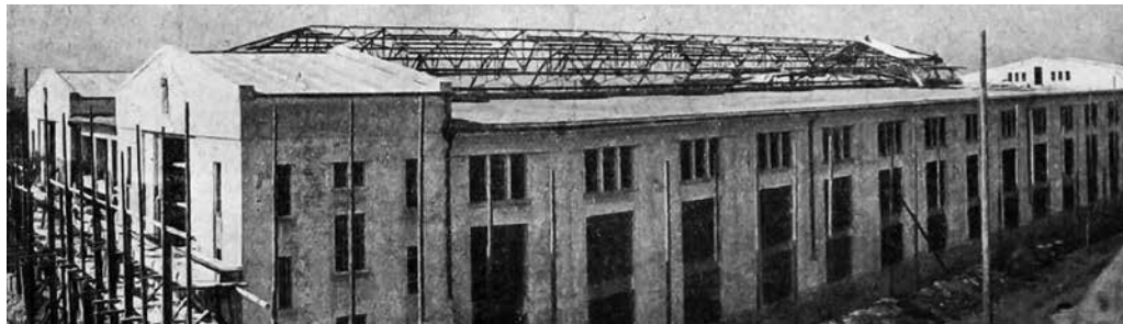
A garázs tetőablakainak vasszerkezete Márkus Lajos gyárában készült

A két teljesen azonos kialakítású, háromemeletes, két lépcsőházas, kislakásos, magas tetős bérházat a telek délkeleti részén, a Báróczy utca és a névtelen utca sarkán építették fel. A téglalap alaprajzú, szimmetrikus elrendezésű, zárt udvaros épületek minden szintjén lépcsőházként két 2 szoba-konyhás és két 1 szoba-konyhás lakás kapott helyet. A klasszicizáló keretezésű házbejáratok oldalról nyílnak, fölöttük lépcsőházi sávablak és kétoldalt lodzsák vannak.