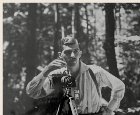
Kinszki Imre sosem érkezett meg a sachsenhauseni lágerbe

Kinszki Imre hagyatéka nagyon szétszóródott. A legjobb képek negatívját a hatvanas években fondorlattal kicsalták az